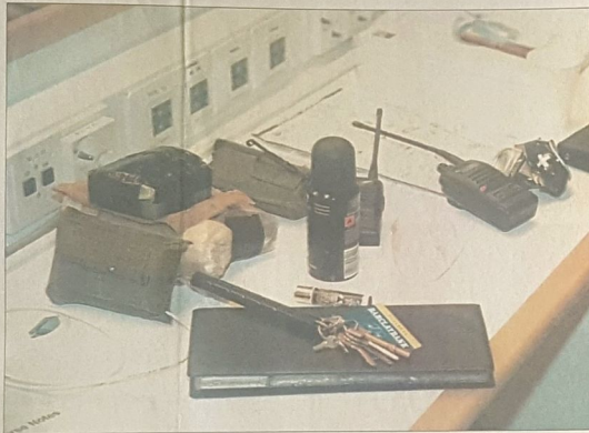
Kaikkia pöydällä olevia esineitä voi käyttää tilapäisaseina, jos kekseliäisyyttä ja ammatillista pahahtausta riittää.

Vantaan aikuisopistuksen kaksien tiloissa Hiekkaharjun Tennistien annetaan opetusministeriön hyväksymää turvallisuusalan koulutusta. Useat suorittavat jopa seitsemän kuukautta kestävä vartiijan